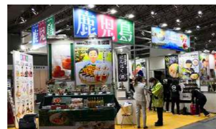
展示会・商談会合同ブース 企画・施工プロデュース