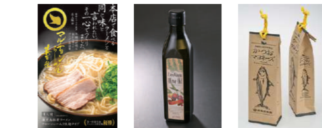
ブランディングロゴ・商品ラベル・パッケージ