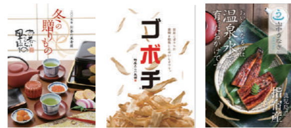
会社案内・カタログ・ポスターなど紙媒体全般