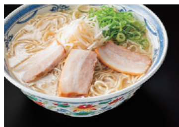
食器類も豊富にスタンバイ