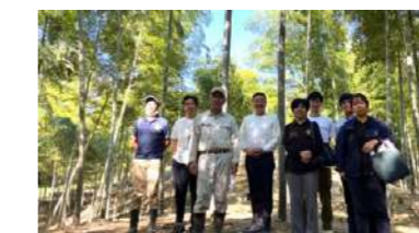
有名シェフを招聘した生産地視察