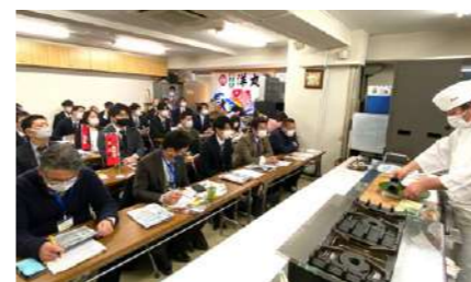
県産食材を使用した料理講習会