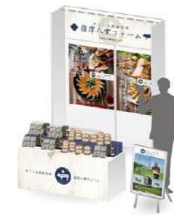
展示会・商談会単体ブース 企画・施工プロデュース

商品企画だけでなく、各種展示会・商談会の企画・デザインなどのコンサルティング業務、セールスプロモーションプロデュース設営も承ります。また、各種補助金を活用し、コスト面も重視した商品展開などのご提案もいたします。